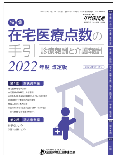
『在宅医療点数の手引』