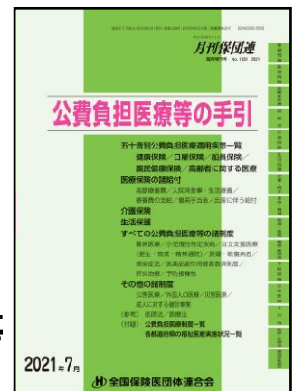
『公費負担医療等の手引』