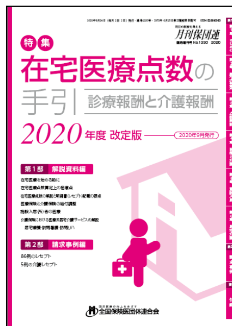
『在宅医療点数の手引』

■備考 三重県保険医協会非会員の方は受講 できません。ただし、会員の医療機 関の職員(勤務の先生方を含む)は 受講できます。