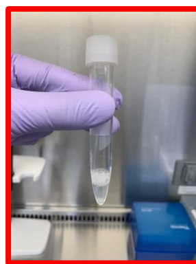
泡が多い 十分量採取されていない